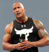
DWAYNE JOHNSON THE ROCK