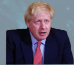
BORIS JOHNSON PREMIERMINISTER DES VEREINTEN KÖNIGREICHS SEIT 2019