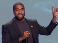
KANYE WEST RAPPER