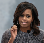
MICHELLE OBAMA EHEM. FIRST LADY USA BIS 2017