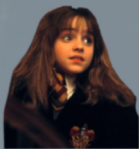
HERMINE GRANGER HARRY POTTER