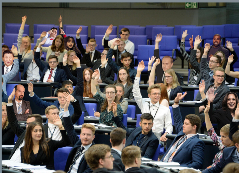
Bildquelle: Deutscher Bundestag Fotograf: Achim Melde Bildnummer: 4370081 https://bilddatenbank.bundestag.de/site/index Bearbeitet von Jasmin Piontek