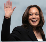
KAMALA HARRIS ERSTE WEIBLICHE VIZEPRÄSIDENTIN DER USA SEIT 2021

Finde in den beiden Bildern folgende 9 Politiker*innen. Vielleicht findest du dabei auch 5 weitere Persönlichkeiten.