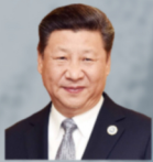
XI JINPING STAATSPRÄSIDENT CHINA SEIT 2013