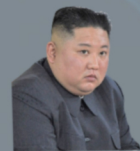
KIM JONG-UN DIKTATORISCHER MACHTHABER NORDKOREA