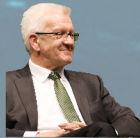
WINFRIED KRETSCHMANN MINISTERPRÄSIDENT BADEN-WÜRTTEMBERG SEIT 2011