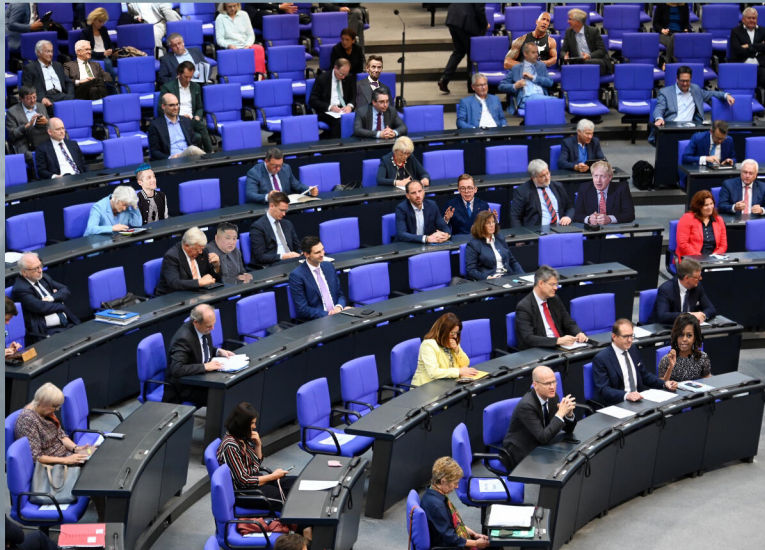
Bildquelle: Deutscher Bundestag Fotograf: Achim Melde Bildnummer: 4513947 https://bilddatenbank.bundestag.de/site/index Bearbeitet von Jasmin Piontek