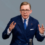
PHILIPP AMTHOR CDU / JUNGE UNION * 1992